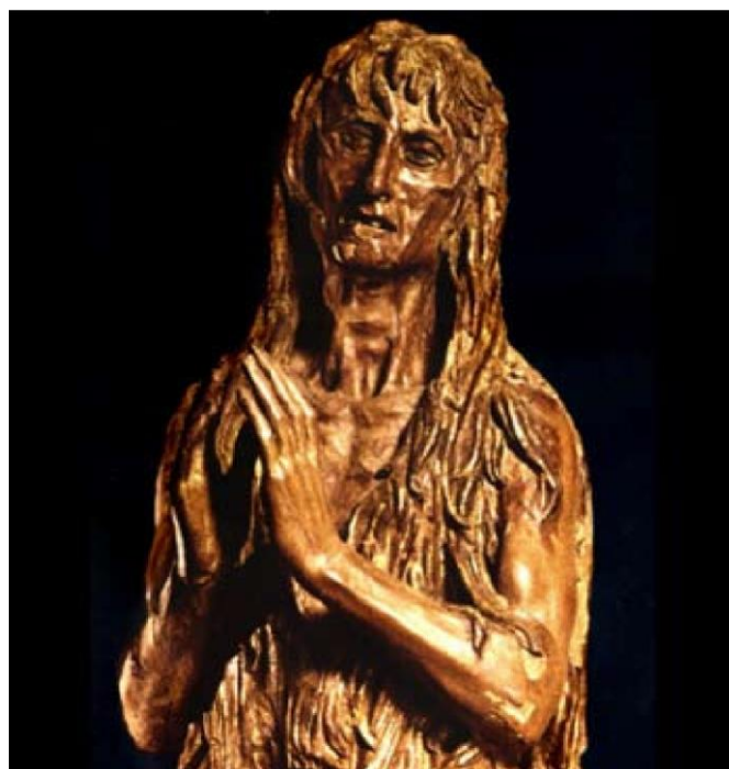
Sf. Maria Magdalena

Sculptură în lemn de Donatello, Florența, Italia