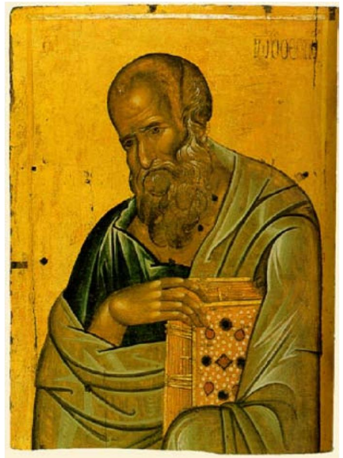
Sf. Ioan Evanghelistul

Evanghelie slavonă, Mănăstirea Neamt, Moldova